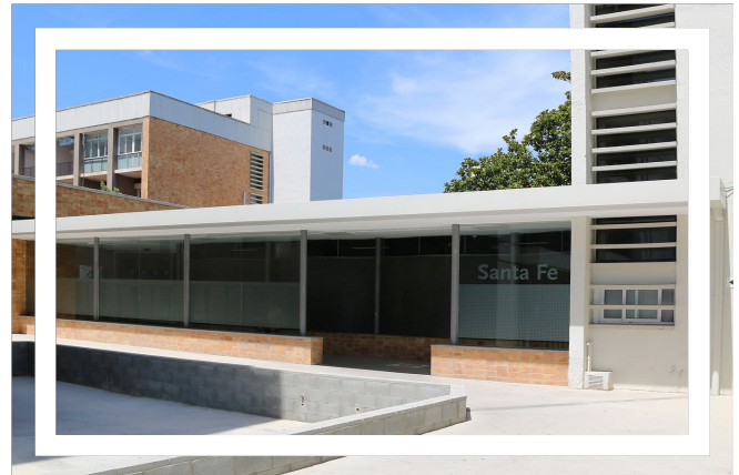
Edificio Santa Fe